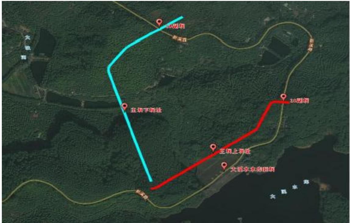
主坝上、下坝址位置示意图